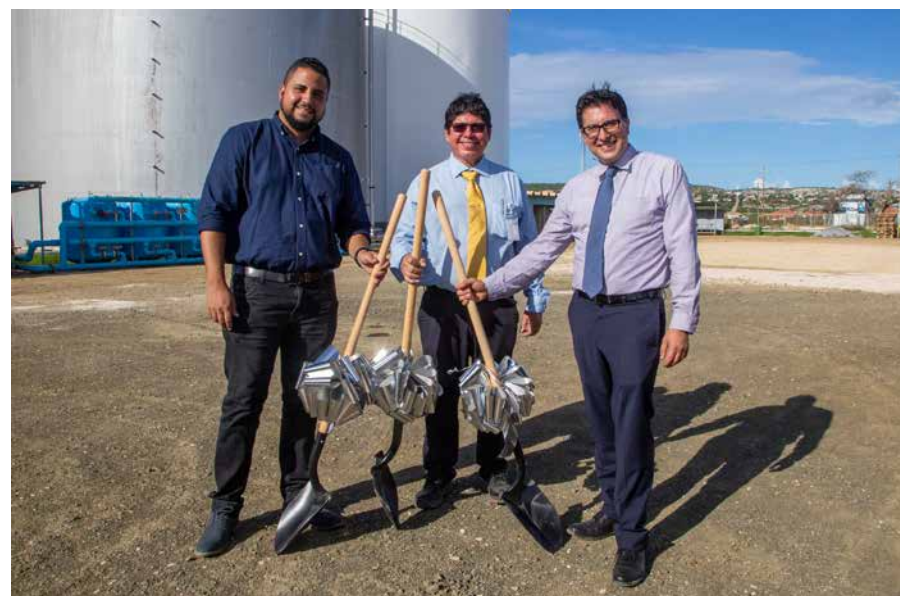
Op 15 november ging de spa de grond in voor een nieuwe waterfabriek.

„WEB deed alleen de distributie. Al vrij snel na mijn komst werd op Bonaire de eerste installatie voor de zuivering van ingezameld afvalwater uit beerputten en septic tanks opgeleverd. Het beheer kwam bij WEB. Anderhalf jaar later kregen wij ook de tweede rioolafvalwaterzuiveringsinstallatie en de daarbij horende inzamelingsinfrastructuur in beheer.“ Daarmee had WEB naast water en elektriciteit een derde business-unit. „Er is veel geïnvesteerd in opleiding en training. Ik ben er trots op hoe goed wij het proces onder controle hebben.“ Het gezuiverde, zogeheten irrigatiewater, is beschikbaar voor landbouw en hotels die er hun tuinen