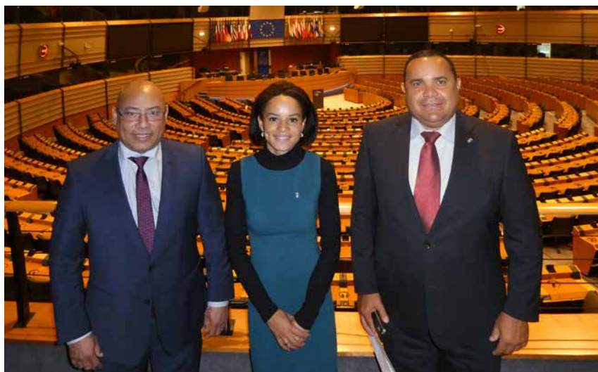
Gezaghebber Edison Rijna en gedeputeerde Elvis Tjin Asjoe kregen een rondleiding van Europarlementariër Samira Rafaela.

Na de twee werkbezoeken die Europarlementariër Samira Rafaela eerder dit jaar aan Bonaire bracht kon een tegenbezoek niet uitblijven. Bij de verkiezingen van mei verwierf ze - mede dankzij de kiezers op Bonaire - voldoende persoonlijke stemmen om een zetel in het Europees Parlement te bemachtigen. De deelname aan de conferentie van de OCTA in Brussel bood gezaghebber Edison Rijna en gedeputeerde Elvis Tjin Asjoe de kans Rafaela op te zoeken. Ze werden hartelijk ontvangen en kregen een rondleiding door het enorme gebouw waar 751 Europarlementariërs kantoor houden en vergaderen. Rafaela werkt er hard aan de Caribische delen van het Koninkrijk op de Europese agenda te krijgen en te houden. Zij nodigde haar Bonairiaanse gasten uit bij haar aan de bel te trekken als ze iets voor Bonaire kan betekenen.