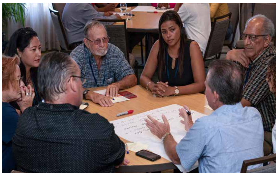
Na enkele inspirerende lezingen te hebben gehoord werden de deelnemers aan de conferentie aan het werk gezet om bouwstenen aan te dragen voor het te ontwikkelen Masterplan 2030.

In de marge van de conferentie werd bekendgemaakt dat Bonaire zich heeft aangesloten bij het wereldwijde, door de Verenigde Naties geïnitieerde netwerk van eilanden die niet alleen zelf zo