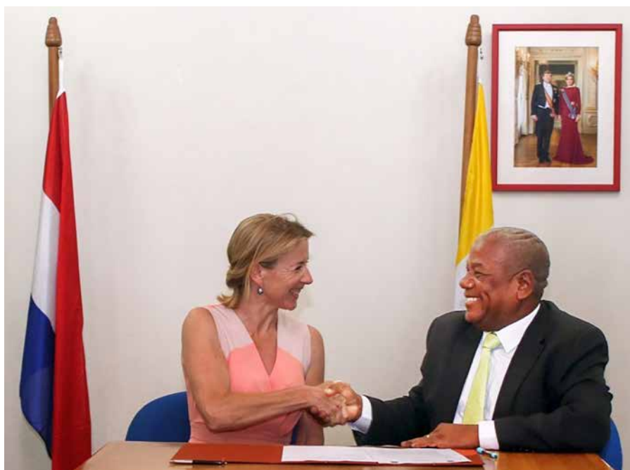
Gedeputeerde James Kroon en (toen nog) staatssecretaris Stientje van Veldhoven binden samen de strijd aan tegen wegwerpplastic.

De strijd tegen het gebruik van wegwerpplastic is een van de speerpunten in het natuur- en milieubeleid van het Bestuurscollege waarmee het uitvoering geeft aan een unaniem door de Eilandsraad aangenomen motie single use plastics zoals bekers, borden, bestek, rietjes, tassen en voedselcontainers te verbieden. Het streven naar een afvalvrij Bonaire maakt deel uit van het Blue Destination-concept.