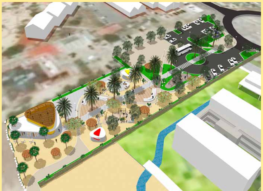
Artist impression van het toekomstige Sunset Beach Park.