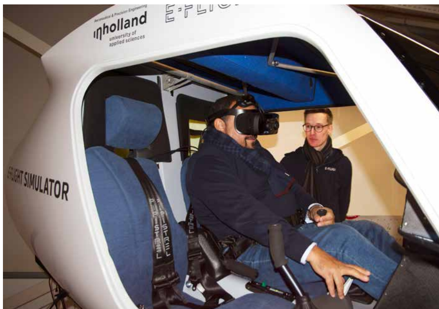
Gezaghebber Rijna maakte in een flight simulator een virtuele elektrische vlucht over Bonaire.

Gezaghebber Rijna benadrukte dat de vlietschool meer dan welkom is. "Wij juichen initiatieven toe die bijdragen aan de verduurzaming van het eiland. Als eerste elektrische vlietschool op het westelijk halfrond zal de academy bovendien veel studenten uit de wijde regio trekken en dat is goed voor de diversificatie van onze economie en werkgelegenheid op een letterlijk en figuurlijk hoog niveau. Er gaan ook lokale instructeurs worden opgeleid." Ter afsluiting van het bezoek maakte de gezaghebber in een flight simulator een virtuele elektrische vlucht over Bonaire.