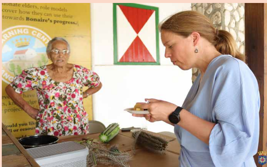
Bij het bezoek aan Mangazina di Rei proefde minister Schouten van de cactussoep.

In 2025 moet het ijkpunt voor een sociaal minimum in Caribisch Nederland stapsgewijs zijn gerealiseerd. Ook moet er dan een vorm van werkloosheidsvoorziening bestaan. Dat belofde minister Carola Schouten (Armoedebeleid, Participatie en Pensioenen) tijdens haar werkbezoek aan Bonaire.