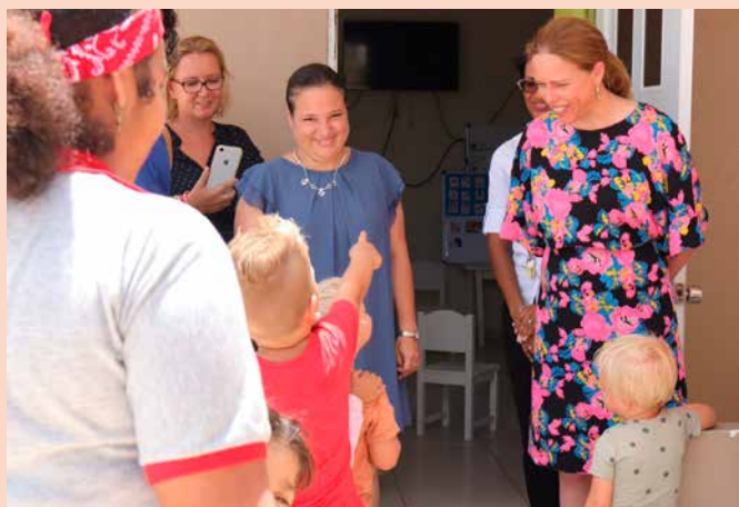
Bij de kinderopvang Boks.