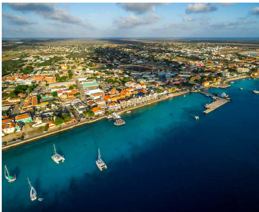
Kralendijk begint vol te raken.

Naast het inkomend toerisme per vliegtuig zijn er ook bezoekers die per cruiseschip komen. Nadat de coronamaatregelen voor Bonaire half maart 2020 ingingen, kwam het cruiseverkeer volledig stil te liggen. Pas sinds september doen er weer cruiseschepen de haven van Kralendijk aan. Waar in november en december 2019 achtereenvolgens zo'n 52.000 en 68.000 passagiers via cruiseschepen naar het eiland kwamen, waren dit er in dezelfde maanden van 2021 slechts 18.000 en 35.000. Voor het cruisetoerisme zijn de maanden november, december, januari en februari hoogseizoen.