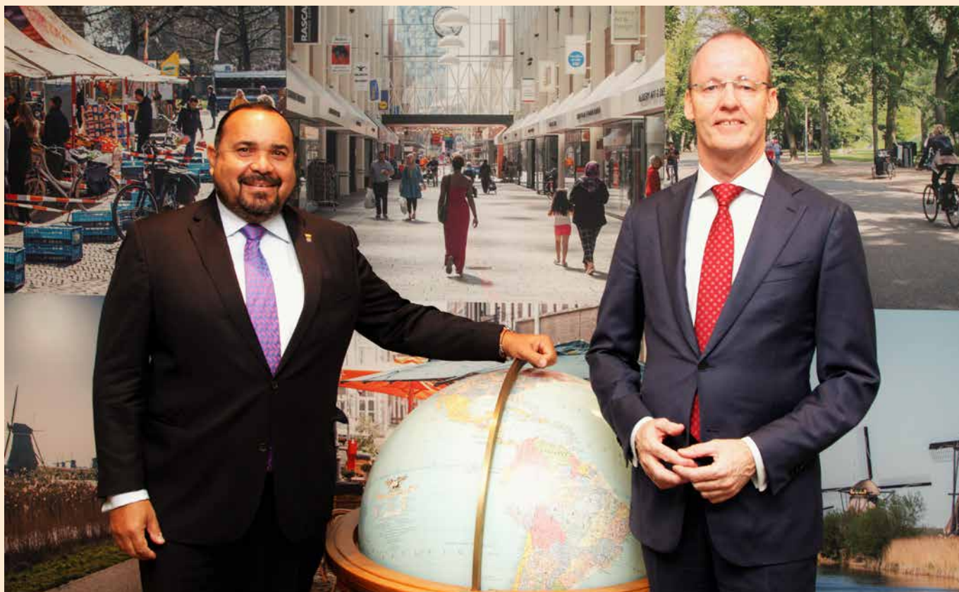
In gesprek met president Klaas Knot van De Nederlandsche Bank.