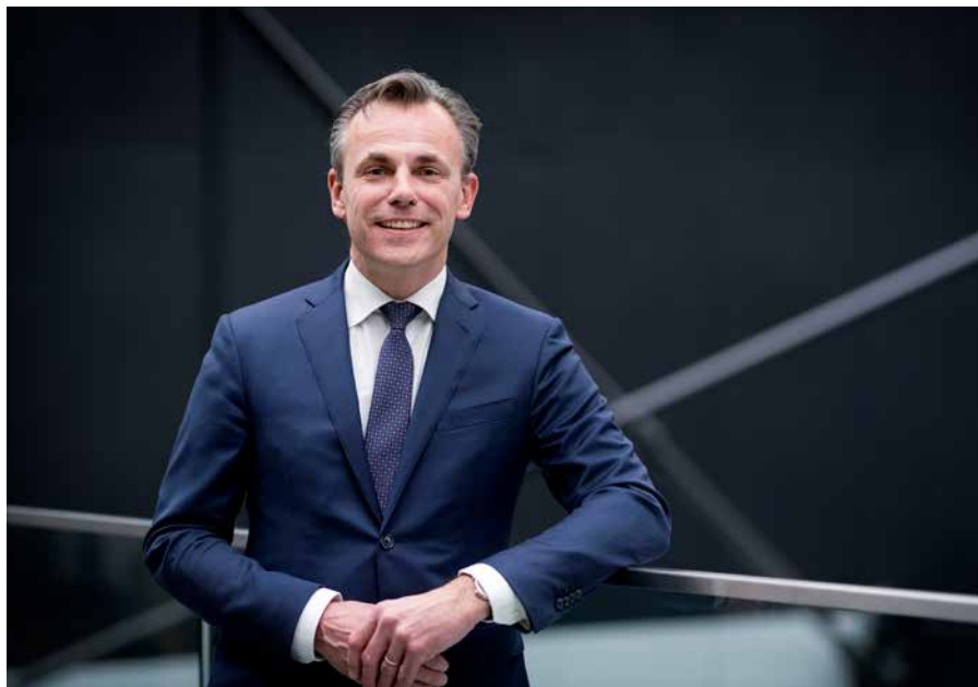
Minister Harbers ziet elektrisch vliegen tussen de ABC-eilanden wel zitten.

Over 4 jaar zullen de eerste vluchten van Bonaire naar Curaçao en Aruba en vice versa met elektrische toestellen kunnen worden uitgevoerd. In 2030 moet de helft van het aantal reizigers tussen de ABC-eilanden elektrisch vliegen en in 2035 vrijwel iedereen. Dat staat te lezen in het Masterplan en de bijbehorende Roadmap Elektrisch Vliegen van het luchthavenadvies- en ingenieursbureau NACO International Aviation Consultancy en het Koninklijk Nederlands Lucht- en Ruimtevaartcentrum.