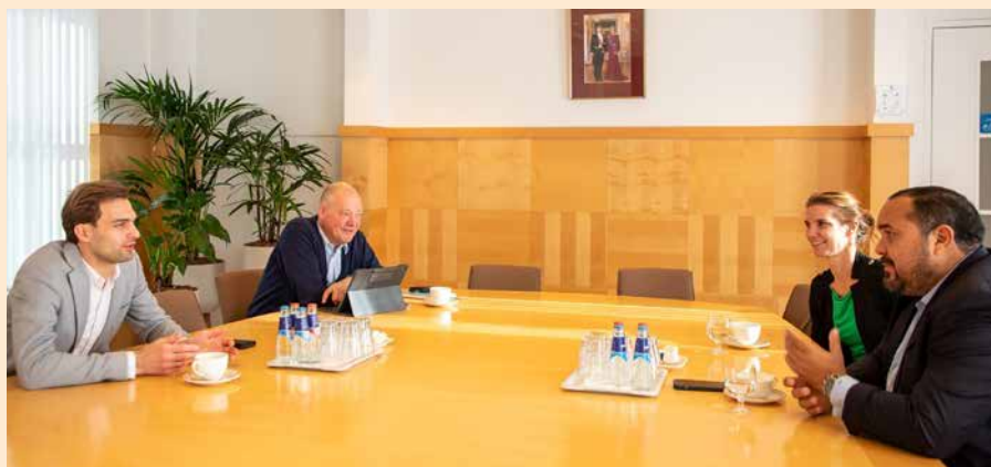
Dank vanwege alle coronahulp was er voor staatssecretaris van Volksgezondheid, Welzijn en Sport Maarten van Ooijen.