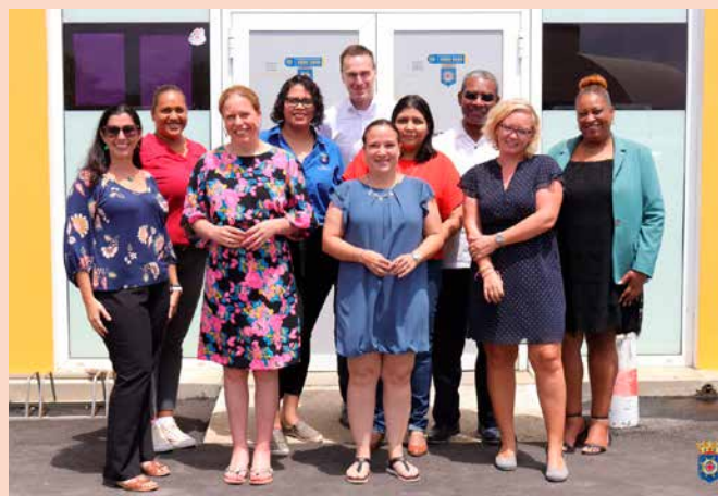
Met het team van de Directie Samenleving en Zorg.