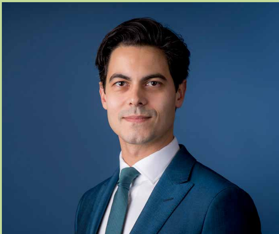
Minister voor Klimaat en Energie Rob Jetten.

Het WEB-plan heeft een gunstig effect op de tarieven. "Verduurzamingsstappen kenmerken zich in tegenstelling tot de fossiele elektriciteitsproductie door hoge investeringskosten en lage operationele kosten. Omdat er minder brandstof nodig is, nemen de productiekosten af. Deze besparing hangt af van de (wereld) olieprijs. Verduurzaming draagt zodoende ook bij aan de ambitie van het kabinet om de levensstandaard te verbeteren en de hoge kosten van levensonderhoud te verlagen voor de inwoners van Caribisch Nederland."